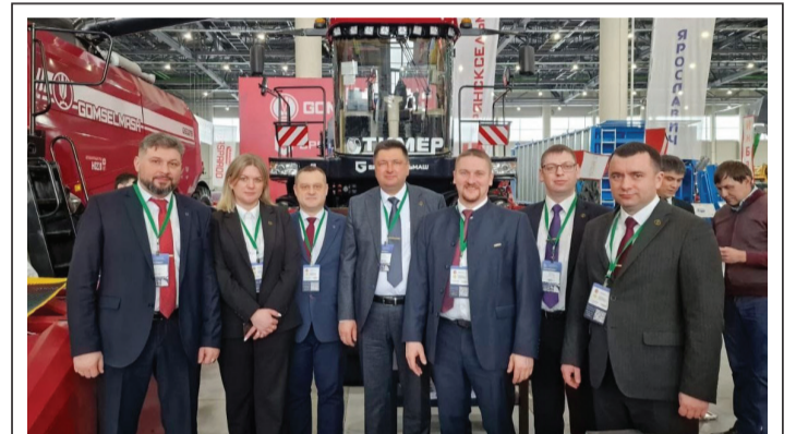
6-7 марта продукция АО «Брянсксельмаш» представлена на V специализированной сельскохозяйственной выставке достижений АПК «ТатАгроЭкспо», которая прошла в МВЦ «Казань Экспо». В течение 2 дней более 200 компаний со всей России на площади свыше 30 тысяч м² демонстрировали сельскохозяйственную технику, оборудование и сырьё для эффективного животноводства, растениеводства, изделий для переработки, хранения и упаковки сельхозпродукции.