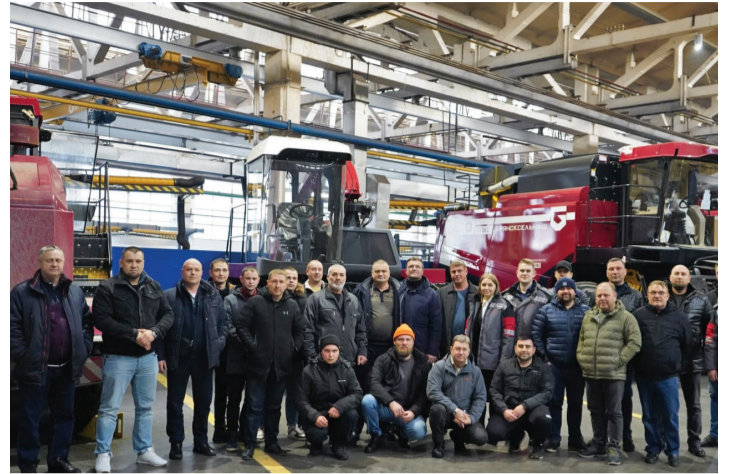
15 ФЕВРАЛЯ АО «Брянсксельмаш» посетила делегация сельхозтоваропроизводителей Ставропольского края.

Краснодарский край является одним из основных сельскохозяйственных регионов России. В крае в 2022 году установили исторический максимум, собрав 15,1 миллиона тонн зерновых и зернобобовых. Рекордным, в частности, стал урожай пшеницы, который составил 10,7 миллиона тонн.