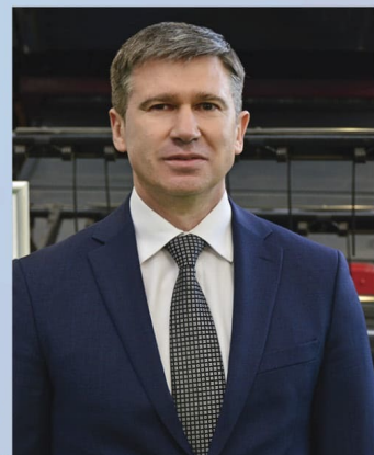
Уважаемые коллеги, дорогие друзья!

Не сомневаясь, что вместе мы, как дружная, сильная и сплочённая команда, сможем преодолеть все возможные сложности и закрепить наши позиции на рынке сельскохозяйственной техники. Залогом тому служат ваши ответственность, трудолюбие и нацеленность на результат.